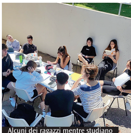
Alcuni dei ragazzi mentre studiano