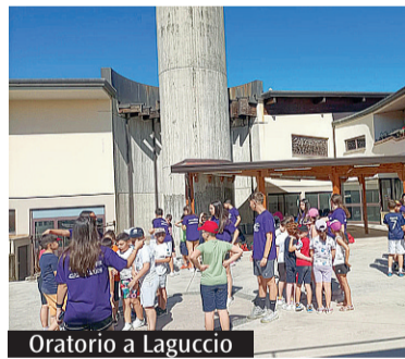
Oratorio a Laguccio

Sono tanti in tutta la diocesi gli appuntamenti con Grest e campi estivi, promossi soprattutto dalle parrocchie, ma anche da realtà oratoriali, associazioni e movimenti. Vediamone in rapida successione qualcuno, senza la pretesa di riuscire a dare un quadro completo delle molteplici iniziative in atto. Partiamo da Anagni e dall'oratorio intitolato a Pier Giorgio Frassati, che ha organizzato un campeggio che si terrà dal 13 al 21 luglio prossimi, a Fiumata, sulle montagne di Filetino, a due passi dalle sorgenti del fiume Aniense; il campeggio, rigorosamente in tenda, è aperto alla fascia di età che va dalla 4ª elementare alle seconde classi delle scuole superiori. E' già iniziato invece il Grest