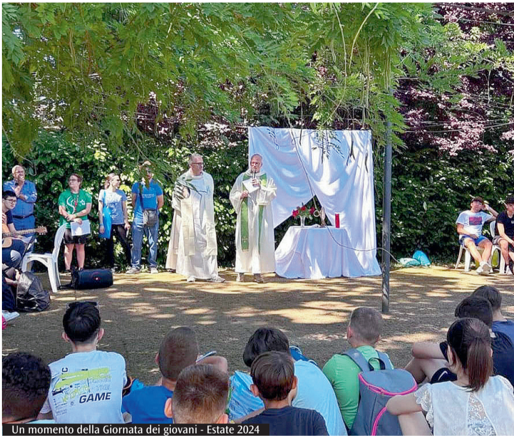
Un momento della Giornata dei giovani - Estate 2024